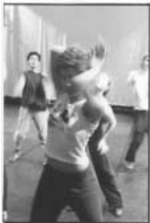
Ballets C. de la B. Stuk voor 8 een stuk Chor. Koen Augustijnen

Dans Stuk voor 8 een stuk , la nouvelle pièce de Koen Augustijnen , fado, musique et chansons pop alternent comme la mélancolie et la gaité de sept personnages qui se rencontrent dans la réception d'un hôtel anonyme. Deux acteurs, cinq danseurs, leurs souvenirs, leurs photos, la musique qu'ils écoutent constituent la toile de fond d'une existence routinière avec son risque réel d'égarement. L'ambiance est cafardeuse. Mais à l'image des oiseaux bariolés, des âmes troublées que décrit Jerzy Kosinsky dans son roman, ces personnages vont chercher à échapper au train train qui les étouffe, à partager avec les autres des moments forts, parfois dans une certaine agitation. Fidélité à un style chanté, joué et dansé et à des préoccupations d'aujourd'hui donc pour cette nouvelle pièce qui verra le jour le 26 mars au Stuk de Louvain.