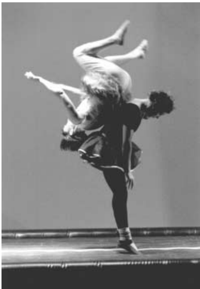
Cie Catastrophe Turbulences

Vitrine virtuelle consacrée à des œuvres d'art ayant un lien avec la danse, www.artdanse.com invite à l'achat de Nijinsky dessiné par Jean Marais ou de Noureev croqué par Serge Lifar. Projet de maquettes, croquis de costumes, aquarelles..., se concentrent autour des Ballets Russes, des Ballets de Paris et de Roland Petit dans cette galerie qui n'est, malgré son nom, que commerciale. Avis aux amateurs.