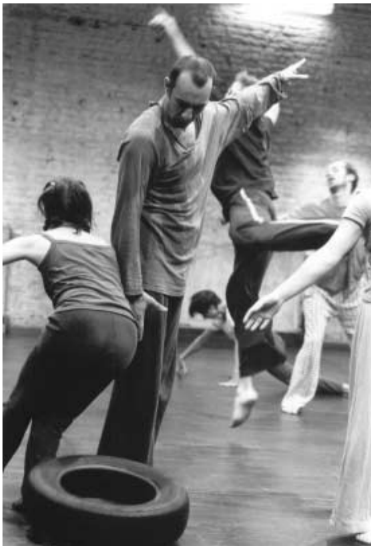
Transition Pièces détachées Projet de Patricia Kuypers

Premier volet d'un projet initié par Fabrice Dugied , Mémoire Vive , le programme Jérôme Andrews rassemblera créations originales, reprises et hommages autour de ce danseur, chorégraphe, pédagogue américain, considéré comme un des pionniers de la danse contemporaine en France, à l'instar de Karin Waehner et Jacqueline Robinson. Avec l'idée de questionner la mémoire et la trace laissée par leur travail, de réunir les empreintes d'un héritage venant de la danse expressionniste allemande à la croisée de la danse moderne américaine, digéré aujourd'hui par ceux et celles qui l'ont reçu. Construit en collaboration avec plusieurs artistes, le projet alterne chorégraphie collective et individuelle ou reprise sous une direction unique. Autour de Jérôme Andrews, on pourra voir une création de Dominique Dupuy pour Françoise Dupuy, un Duo de et par Christine Kono et Dimitris Kranotis, un autre de et par Fabrice Dugied et Elsa Wolliaaston, un solo de et par Vivianne Serry et la reprise de Le jour où la terre tremblera , une chorégraphie que Jérôme Andrews avait créée en 1958 et qui sera dansée par Christine Gérard et Paco Décina. Si Le Regard du Cygne à Paris est le producteur artistique du projet, trois centres chorégraphique nationaux se sont engagés à prendre le relais pour permettre à chacun des programmes de voir le jour. A suivre, donc, après la création de ce premier volet le 13 mars au CCN Montalvo-Hervieu de Créteil et à Paris en avril.