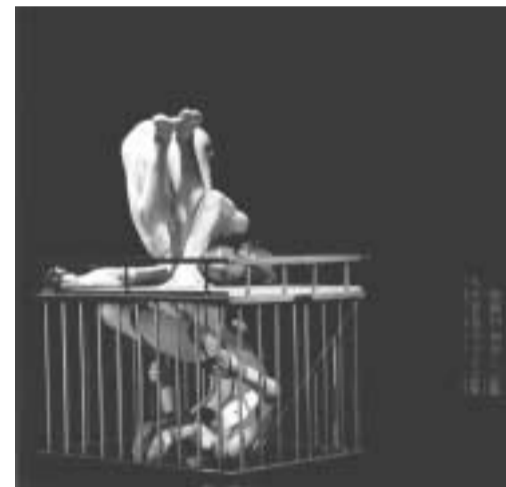
Lijfstof Cbor. Charlotte Vanden Eynde/Hugo De Haes

26-27/3 Déjà Donné/Lenka Flory & Simone Sandroni Fair Copy Stadsschouwburg (050/44 30 60)