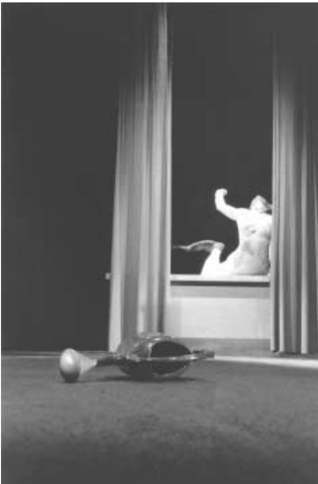
Goma Dos Vert-Tige