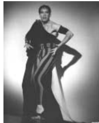
Mémoire vive un projet de Fabrice Dugied Jérôme Andrews dans Oedipe

Premier volet d'un projet initié par Fabrice Dugied , Mémoire Vive , le programme Jérôme Andrews rassemblera créations originales, reprises et hommages autour de ce danseur, chorégraphe, pédagogue américain, considéré comme un des pionniers de la danse contemporaine en France, à l'instar de Karin Waehner et Jacqueline Robinson. Avec l'idée de questionner la mémoire et la trace laissée par leur travail, de réunir les empreintes d'un héritage venant de la danse expressionniste allemande à la croisée de la danse moderne américaine, digéré aujourd'hui par ceux et celles qui l'ont reçu. Construit en collaboration avec plusieurs artistes, le projet alterne chorégraphie collective et individuelle ou reprise sous une direction unique. Autour de Jérôme Andrews, on pourra voir une création de Dominique Dupuy pour Françoise Dupuy, un Duo de et par Christine Kono et Dimitris Kranotis, un autre de et par Fabrice Dugied et Elsa Wolliaaston, un solo de et par Vivianne Serry et la reprise de Le jour où la terre tremblera , une chorégraphie que Jérôme Andrews avait créée en 1958 et qui sera dansée par Christine Gérard et Paco Décina. Si Le Regard du Cygne à Paris est le producteur artistique du projet, trois centres chorégraphique nationaux se sont engagés à prendre le relais pour permettre à chacun des programmes de voir le jour. A suivre, donc, après la création de ce premier volet le 13 mars au CCN Montalvo-Hervieu de Créteil et à Paris en avril.